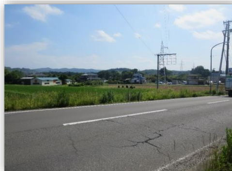
☆現地入口付近幹線道路写真