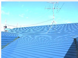
② 下塗り (ケレン後)